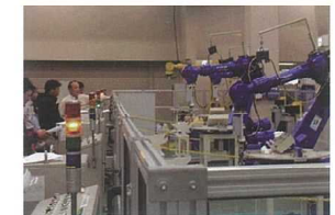
産業用ロボット実技講習