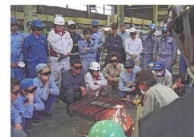
ガス溶接実技講習