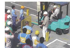
フォークリフト実技講習